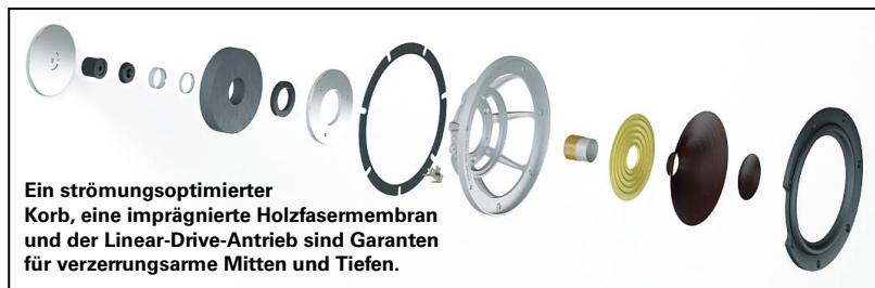
Ein strömungsoptimierter Korb, eine imprägnierte Holzfasermembran und der Linear-Drive-Antrieb sind Garanten für verzerrungsarme Mitten und Tiefen.

Platten unter Hitzeeinwirkung in Form gebracht. Während die Front 35 Millimeter stark ist, wurde aus der über 50 Millimeter massiven Rückseite die Terminalauflage im wahrsten Wortsinn aus dem Vollen gefräst. Formschöne Bassreflexrohre münden ebenfalls im schlanken Heck.