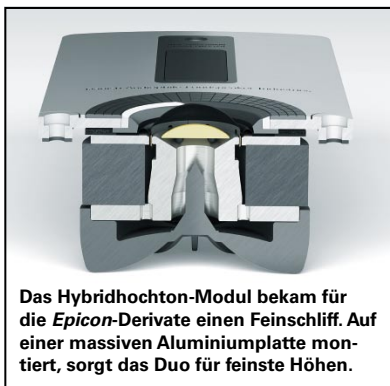
Das Hybridhochtton-Modul bekam für die Epicon -Derivate einen Feinschliff. Auf einer massiven Aluminiumplatte montiert, sorgt das Duo für feinste Höhen.