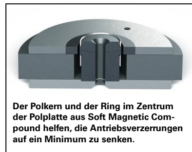
Der Polkern und der Ring im Zentrum der Polplatte aus Soft Magnetic Compound helfen, die Antriebsverzerrungen auf ein Minimum zu senken.

Das Heimkino-Set perfekt macht der Sub P-10 DSS , ein geschlossener Subwoofer mit nach unten gerichtetem 25er-Basstreiber sowie zwei zur Seite gerichteten Passivmembranen. Satte 300 Watt in Class-D-Technik treiben die aktive Sandwich-Membran aus Karbonfaser und Zellstoff an. Auch die beiden passiven Akteure bestehen