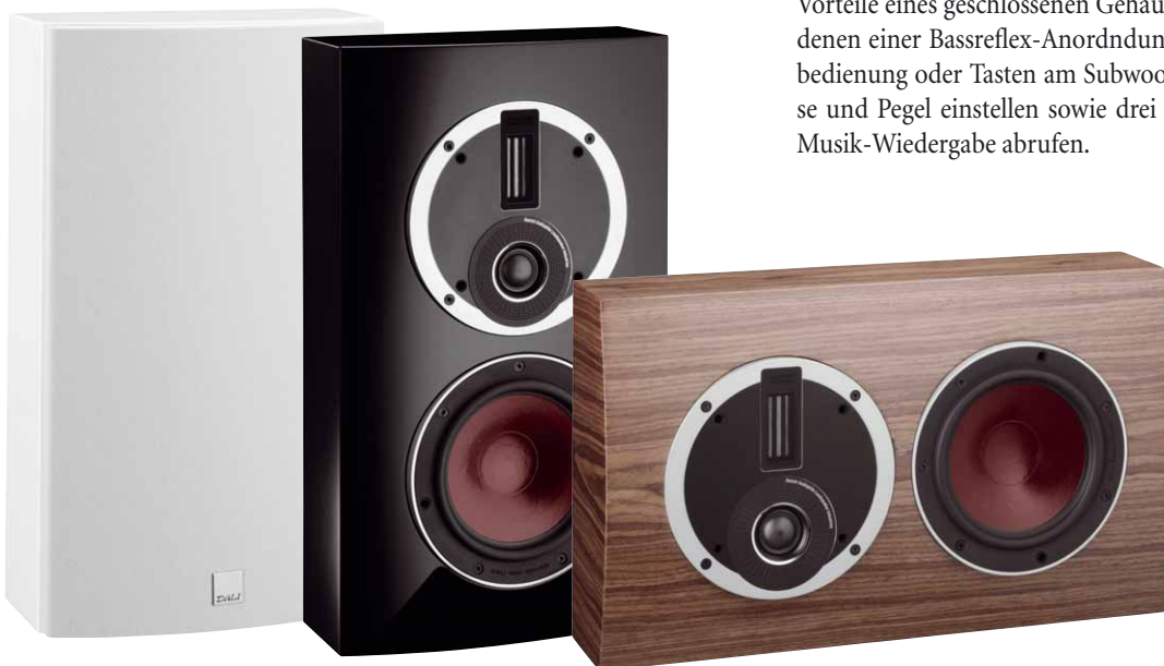
Der Allrounder Rubicon LCR macht in jeder Position und Farbvariante eine gute Figur

Dali spendierte der Rubicon LCR technologische Highlights aus der innovativen Top-Serie Epicon und bietet somit Topklang in einer attraktiven Preisklasse. Für Heimkino-Anwendungen ist die Rubicon LCR mit Abmessungen von 335 x 350 mm und einer Tiefe von knapp 200 mm für die Wandmontage neben einem Großbild-TV oder einer Leinwand ideal geeignet. Ihr exzellent verarbeitetes Gehäuse ist wahlweise in Hochglanz-Schwarz, Hochglanz-Weiß oder Echtholzfurnieren (Walnuss, Rosso) erhältlich und verfügt bereits ab Werk über solide Aufhänge-Ösen auf der Rückseite. Auch findet man dort eine trickreich konstruierte Bassreflexöffnung, die auch bei Wandmontage der LCR problemlos funktioniert. Grundsätzlich handelt es bei der Rubicon LCR um eine 2-1/2-Wege-Konstruktion, bestehend aus einem Tiefmitteltöner mit der Dali-typischen, rotbraunen und äußerst resonanz-