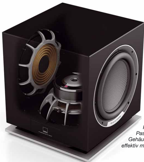
Dank der „Rücken an Rücken“ eingebauten Passivmembranen werden Gehäuseresonanzen effektiv minimiert

Spätestens seit der Einführung der Dali Rubicon LCR müssen Kritiker von On-Wall-Lautsprechern sämtliche Vorurteile gegenüber flachen, wandmontierten Lautsprechern über Bord werfen. Diese durchweg audiophilen Lautsprecher entsprechen der Erwartungshaltung anspruchsvoller Musikliebhaber ohne Probleme und erfüllen ebenso gut die Bedürfnisse eines ambitionierten Heimkino-Besitzers. Tonal ohne Fehl und Tadel, dynamisch im Charakter und äußerst breitbandig im Frequenzspektrum halten die Rubicon LCR jeden Vergleich mit konventionellen Standlautsprechern stand. Als 5.1-Konstellation brilliert das Set zudem durch seinen homogenen Charakter und ist definitiv die erste Wahl, wenn es darum geht, ein Referenzklasse-Heimkino mit einer optisch und klanglich perfekten On-Wall-Lösung zu realisieren.