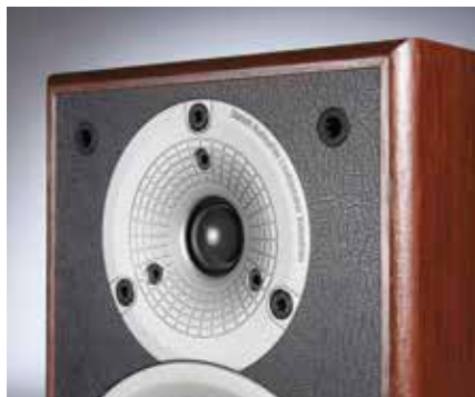
▲ Der Hochtöner strahlt breit ab und benötigt – wenn überhaupt – nur eine geringe Einwinkelung.

belegbar und auch akustisch nachvollziehbar: Rutschen Sie also auf dem Sofa mal ein wenig hoch oder runter, bis Sie das Gefühl haben, dass der Klang sauber einrastet. Damit die DALIs ihre zahlreichen positiven Eigenschaften voll entfalten können, wählten wir den kompakten, aber leistungsstarken und klanglich makellosen Musical 225 – und verblüfften so alle Zuhörer. Einen derart raumfüllenden, kraftvollen Klang selbst in einem gut 20 m 2 großen Raum bei Tschaikowskys „Hopak Tanz“ hätte ihr niemand zugezogen. Wie die Dänen dieses Downsizing schaffen, bleibt ihr Geheimnis.