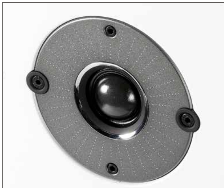
Die neuentwickelte 29mm Gewebe-Hochtonkalotte löst fein auf und spielt doch sanft

Der Lautsprecher ist ausgelegt als reine 2-Wege Bassreflexbox, beide Tief-/Mitteltöner arbeiten also parallel, die Reflexöffnung befindet sich auf der Rückseite des stabilen, ausser an der Rückseite sorgfältig bedämpften MDF-Gehäuses. Die Frequenzweiche ist von eher konventioneller Machart, der Durchgang im Meßlabor zeigte keinerlei Auffälligkeiten, sondern belegte, dass die Dänen hier saubere Arbeit abgeliefert haben. Niedrige Verzerrungen, ordentlicher Wirkungsgrad, ziemlich weit nach unten